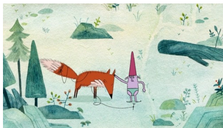
LE GNOME ET LE NUAGE Filip Diviak, Zuzana Čupová