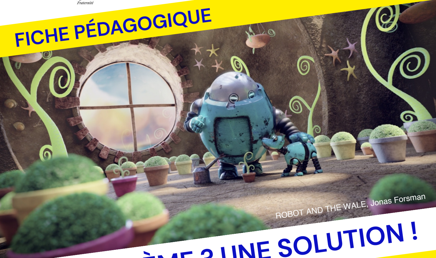
ROBOT AND THE WHALE, Jonas Forsman